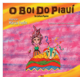
O BOI DO PIAUÍ Adaptação: Márcia Evelin Editora: Nova Aliança